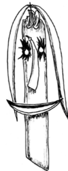
tête en bois 2